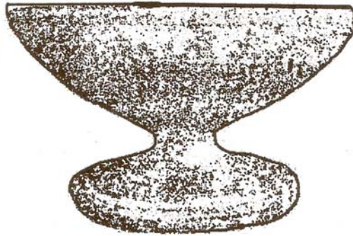
ចានជើងធ្វើពីជីគង្គ