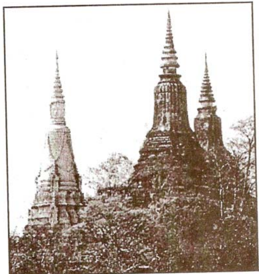
ចេតិយនៅលើភ្នំព្រះរាជទ្រព្យ (ដកស្រង់ចេញពីសៀវភៅ សិក្សាសង្គមថ្នាក់ទី ១១ ទំព័រ ១៨៧ បោះពុម្ពឆ្នាំ២០០០)

ព្រះជ័យវរ្ម័នទី ២ បានឡើងសោយរាជ្យនៅ គ.ស. ១៦១៨ ដោយមានព្រះនាមសំរាប់រាជ្យថា សម្តេចព្រះនាមសំរាប់រាជ្យថា ព្រះជ័យវរ្ម័នទី ២ ។ អ្នកប្រវត្តិសាស្ត្រនិយមហៅព្រះអង្គថា ព្រះជ័យវរ្ម័នទី ២ ។ ព្រះអង្គបានតាំងជា មហាឧបរាជហើយទទួលព្រះនាមថា ព្រះ ឧទ័យ ចរមនា ។ ឯព្រះបិតាលោកគង់នៅជាឧបរាជ ប៉ុន្តែ នៅឆ្នាំក្រោយព្រះអង្គក៏សោយទិវង្គតទៅក្នុង ព្រះជន្មាយុ ៦៤ វស្សានៅព្រះរាជវាំង ល្វាងម ។